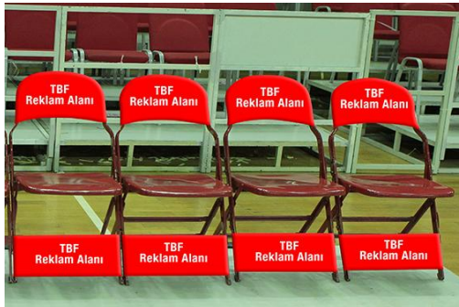
ÇİZİM - 8