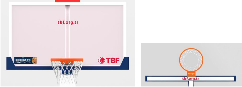
ÇİZİM - 1