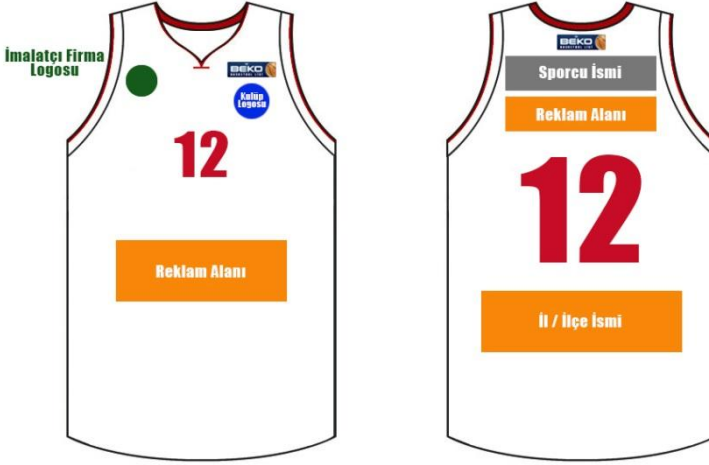
ÇİZİM - 10