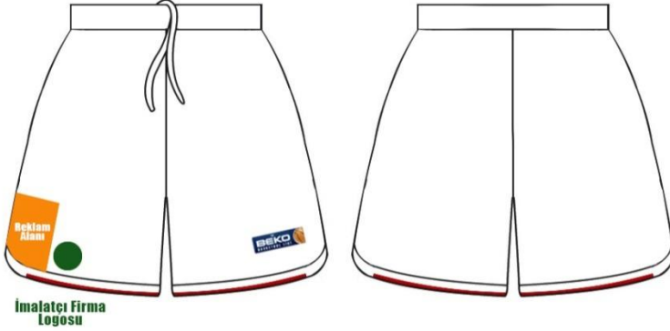
ÇİZİM - 11

Sporcular ancak yazılı doktor tavsiyesi olması halinde şortun altına madde 83.3.5 de belirtilenden daha uzun tayt giyebilirler.