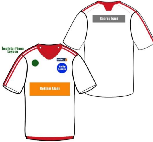
ÇİZİM - 13

83.7. Sporcuların bu yönergelere aykırı olarak başka aksesuar kullanması yasaktır.