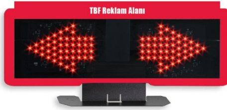
ÇİZİM - 9