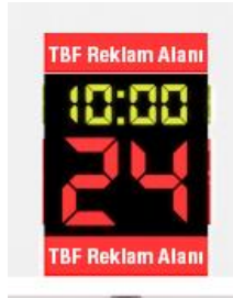
ÇİZİM - 6

24 Saniye Gösterge Panosu alt ve/veya üst kenarında (bknz. Çizim 6) , salonun dört tarafından da görülecek şekilde, 24 saniye göstergesinin görünürlüğüne kısıtlamamak şartı ile Lig logosu ve/veya Lig partner/sponsor logosu veya reklam yer alabilecektir. Bu alanda hangi logonun veya reklamın kullanılacağı TBF tarafından kulüplere bildirilecektir.