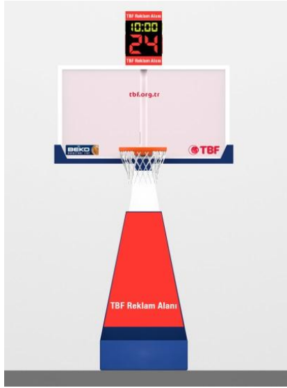
ÇİZİM - 3