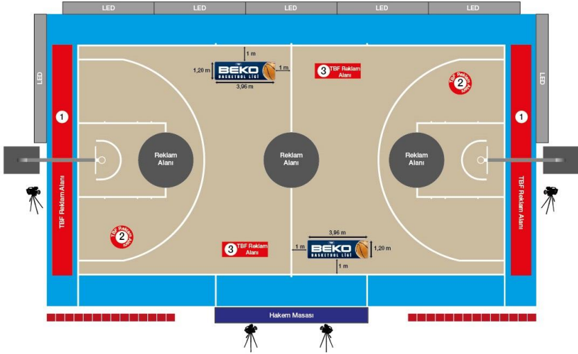
çizim - 7.b

78.3. Her bir kulüp, Ligin en büyük destekçisi olan Lig isim sponsorunun reklamının yayınlanabilmesi amacıyla elektronik reklam panolarında 300 saniye reklam yeri sağlayacaktır. Bu süre çıkarıldıktan sonra kalan sürenin kulüp ve TBF arasındaki paylaşımı, tarafların hakları her bir çeyreğe eşit olarak dağıtılacak şekilde, aşağıda belirtilmiştir.