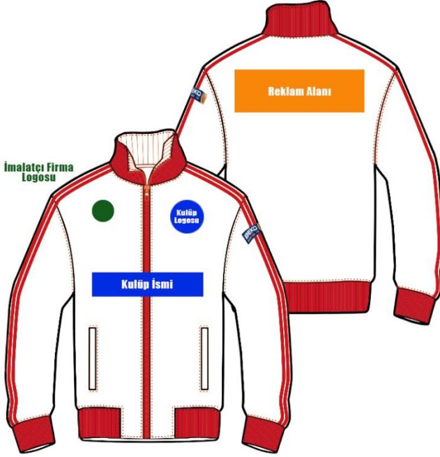
ÇİZİM - 12