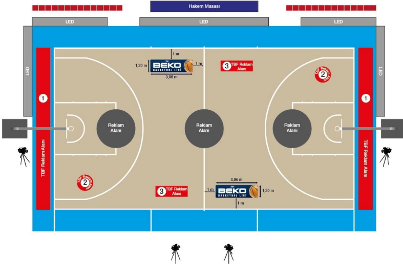
çizim - 7.a

78.2. Kulüp ve TBF arasında, reklam süresi hakları konusunda yapılacak paylaşım anlaşması ile elektronik reklam panoları, mülkiyeti TBF'ye ait olacak şekilde, TBF tarafından sağlanarak kulüplerin kullanımına sunulabilir.