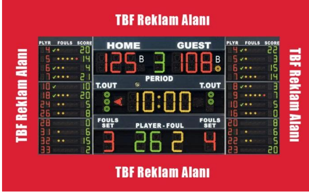
ÇİZİM - 5

logosu veya reklam yer alabilecektir. Bu alanda hangi logonun veya reklamın kullanılacağı TBF tarafından kulüplere bildirilecektir.